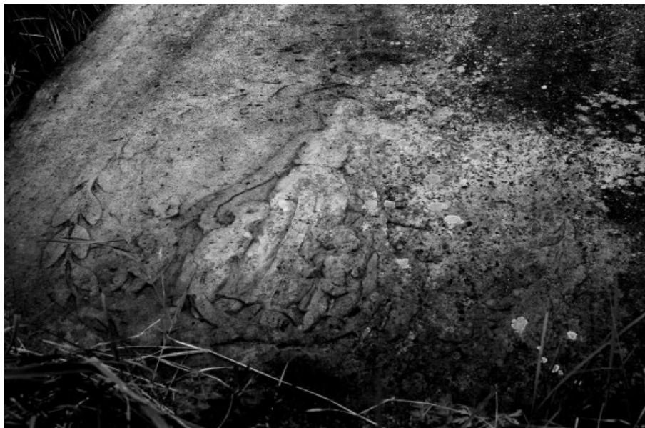
Il. 1. Fragment płyty z Borek. Cmentarz protestancki – Borki (pow. bydgoski). Fot. Michał P. Wiśniewski, 2016 r.

2. Płyta z Wielkiego Wełcza [Il. 2]. Druga, nie mniej cenna, pozioma płyta nagrobna znajduje się na cmentarzu protestanckim w Wielkim Wełczu (gm. Grudziądz, pow. grudziądzki). Wykonano ją z szarego wapienia. Nie odnaleziono na niej żadnych napisów. Zdobiona jest dwoma tondami, wewnątrz których umieszczono płaskorzeźby przedstawiające motywy związane z życiem biblijnego patriarchy Jakuba. W górnej części płyty umiejscowiono przedstawienie walki Jakuba z aniołem 9 , natomiast u jej podstawy ukazano równie popularny motyw „Drabiny Jakubowej” ( Himmelsleiter ) 10 . Trudno ocenić wiek omawianej płyty, przypuszczalnie pochodzi ona z przełomu XVIII i XIX w.