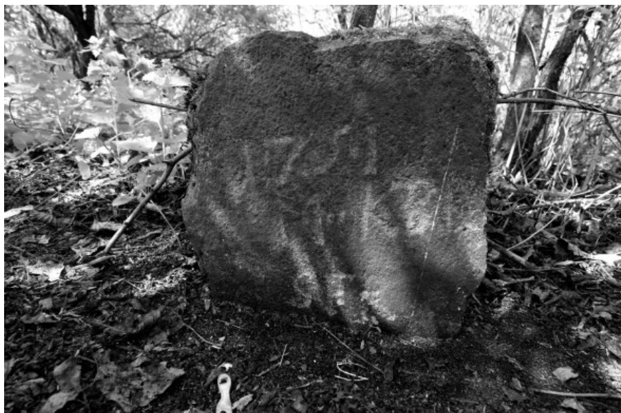
Il. 3. Kamień nagrobny. Cmentarz protestancki w Przechówku (pow. świecki).