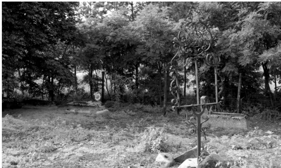
Il. 5. „Wihajster”. Cmentarz protestancki w Błocie (pow. chełmiński). 2016 r.

cmentarzu protestanckim w Błocie (gm. Unisław, pow. chełmiński). Żaden z nich nie zachował się w całości, gdyż z uwagi na materiał konstrukcyjny stanowią one cenny łup dla złomiarzy. Fragmenty tego typu metaloplastycznych obiektów można spotkać m.in. na cmentarzu w pobliskich Brukach Kokocka (gm. Unisław, pow. chełmiński). Na podstawie materiałów ikonograficznych wiadomo, że takie żeliwne pomniki nagrobne rozpowszechnione były również m.in. na Dolnym Śląsku 17 .