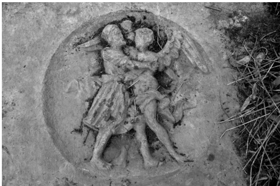
Il. 2. Motyw „Walka Jakuba z aniołem”. Cmentarz protestancki w Wielkim Wetczu (pow. grudziądzki). Fot. Michał P. Wiśniewski, 2016 r.

3) Kamień z Przechówka [Il. 3]. Kamień, gład lub kopce kamieni ustawione w celu oznaczenia miejsca pochówku to jedna z najstarszych form upamiętnienia zmarłych, występująca już w neolicie 11 . W zbiorach Muzeum Etnograficznego w Toruniu znajduje się kamień pochodzący z cmentarza protestanckiego w Sosnowce (gm. Grudziądz, pow. grudziądzki), który jest bodajże najstarszym tego typu obiektem znalezionym na cmentarzach extra muros na terenie województwa kujawsko-pomorskiego. Wyrzyto na nim inskrypcję z datą 1691 12 . Tymczasem na cmentarzu protestanckim w Przechówku (gm. Świecie, pow. świecki) zachował się kamień z inskrypcją, na której poza literami dostrzec możemy datę 1751 albo 1754. Weryfikacja hipotezy o upamiętnieniu w ten sposób pochówku osoby zmarłej w 1754 r. wymaga przede wszystkim prawidłowego odczytania całego napisu i jego analizy, czego dotychczas nie wykonano.